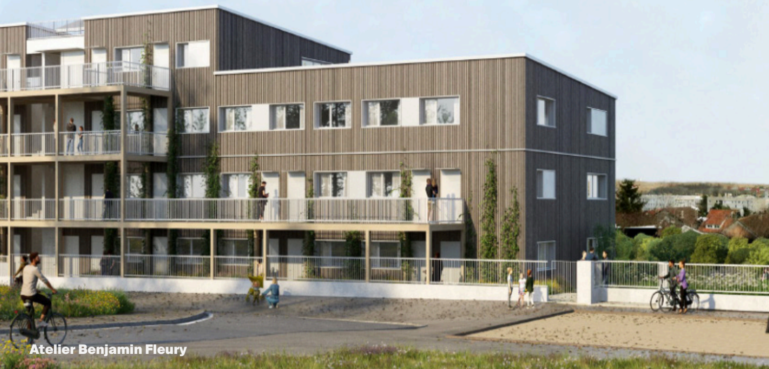
Atelier Benjamin Fleury